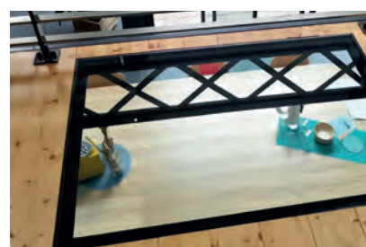
TABLE EN VERRE

Coin repas ou télétravail, créez votre table ou bureau en verre sur mesure avec un verre trempé clair, extra-clair ou dépoli à vos dimensions et à la forme souhaitée (rectangle, rond, oval ou selon croquis.) Les pieds avec un système de fixations adaptées sont prêts à monter.